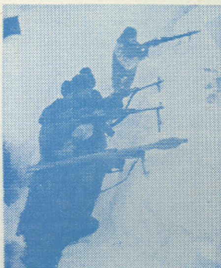
Gospodarstvo i oko njega